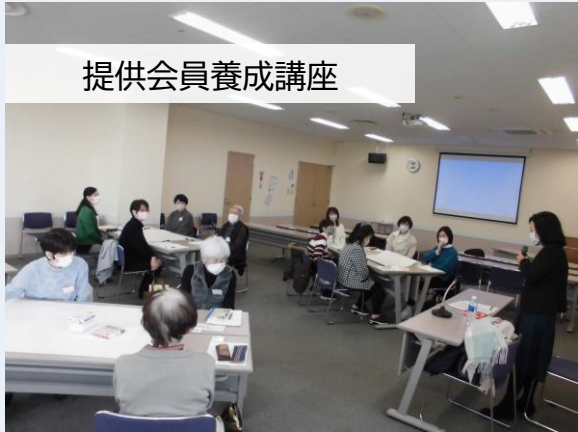
提供会員養成講座

提供会員として活動したい方はまずこの講座を受講していただきます。 子育てや孫育て、スキルアップの機会 としてもご活用ください。今年度も4回の講座開催が決定！